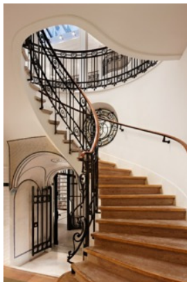
Apple Store, Opéra, Parijs, trap naar de kelder