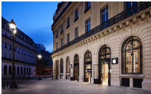
Apple Store, Opéra, Parijs, buitenaanzicht