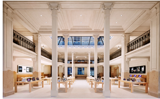
Apple Store, Opéra, Parijs

Apple is voor iedereen bekend als een computermerk, maar natuurlijk ook van de hedendaagse gadgets als iPod, de iPhone en de iPad. Nu is de vraag natuurlijk: "Wat doet een projectmanagement bureau bij Apple?" Naast dat deze producten veel technologie bevatten moeten deze natuurlijk ook ergens verkocht worden. Momenteel gebeurt dat in Nederland bij 'Apple resellers' maar in de grotere steden in Europa, en de rest van de wereld gebeurt dit met name vanuit Apple Stores. Voor het realiseren van deze Apple Stores is Archiment nu ongeveer vier maanden bezig voor Apple, op stuk voor stuk unieke locaties in diverse steden in Europa. Met name in Frankrijk, Italië, Zwitserland en Duitsland.